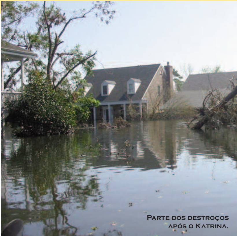
PARTE DOS DESTROÇOS APÓS O KATRINA.