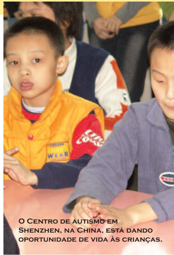
O CENTRO DE AUTISMO EM SHENZHEN, NA CHINA, ESTÁ DANDO OPORTUNIDADE DE VIDA ÀS CRIANÇAS.